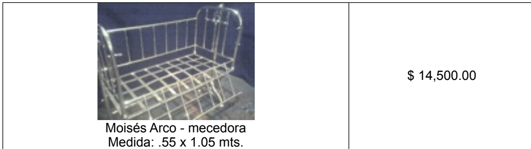
Moisés Arco - mecedora Medida: .55 x 1.05 mts.